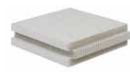
Panneau à base minérale VMO avec liaison rainée crêtée