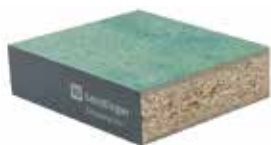
Panneau à base de bois PSF avec film Alu

Découvrez notre large gamme de panneaux de sol. Tous les panneaux de faux-planchers de même type sont interchangeables. Grâce aux bords biseautés, ils peuvent être facilement soulevés et remis en place.