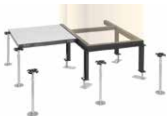
Châssis, cadre de base

Des solutions sur mesure et une installation adaptée, voilà les clés de la réussite des faux-planchers qui vous séduiront également par leur esthétique et leur fonctionnalité optimale. Les accessoires polyvalents, conçus de manière optimale pour répondre à tous les besoins, sont essentiels, car ils permettent de multiplier les avantages et les fonctionnalités. Ainsi, nous concevons des structures de châssis pour les armoires de commande, nous comblons les différences de niveaux et réalisons des finitions convaincantes ainsi que des revêtements et des ouvertures adaptés aux passages de câbles et à la circulation de l'air refroidi.