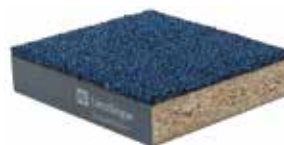
Panneau à base de bois DSB Panneau fin < 30 mm