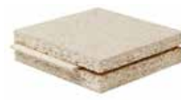
Panneau à base de bois VSF avec liaison rainée crêtée