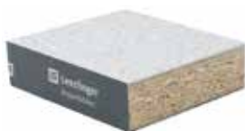
Panneau à base de bois PSB avec tôle d'acier