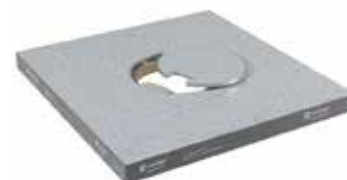
Boîtes de sol