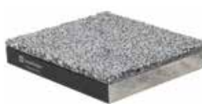
Panneau à base minérale DMB Panneau fin < 30 mm