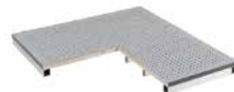
Panneaux de ventilation