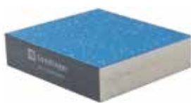
Panneau à base minérale PMB avec tôle d'acier