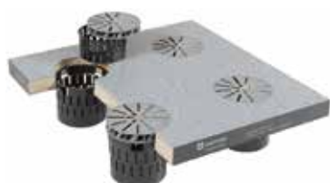
Diffuseurs d'air, grilles de ventilation