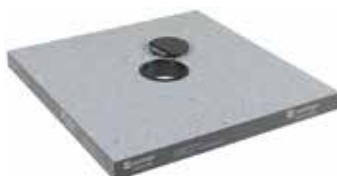
Passages de câbles